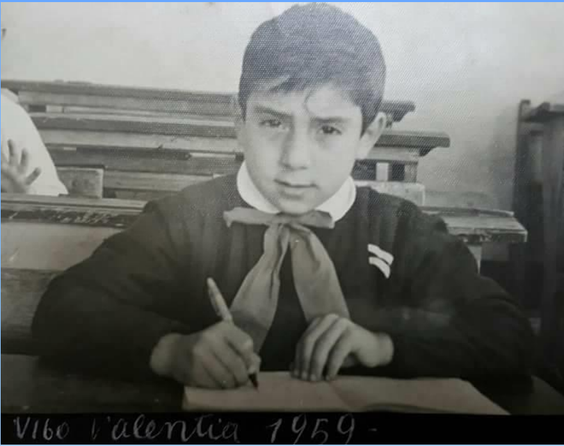
Vibo Valentia 1959 -